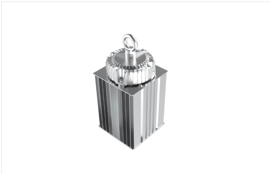
Рисунок 1. GSB с подвесным креплением.